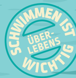
Illustration: Andi Wolff, Gestaltung: Emrich, büro-für-design.de || Stand 08/2020